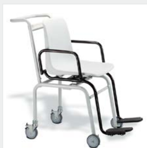
Mobilna waga krzesłkowa seca 956