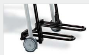
wygodnie podnóżki mogą być całkowicie wsunięte pod siedzisko

Wygodny transport pacjenta dzięki 4 podgumowanym, łatwo obracającym się kółkom. 2 kółka z hamulcami.