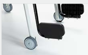
podnóżki można złożyć by ułatwić siadanie i wstawanie