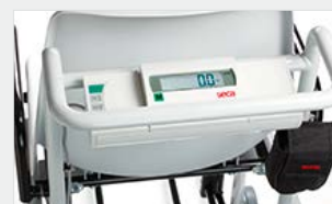
zasilanie elektryczne lub akumulatorowe