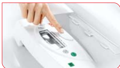
Szalka odłącza się od podstawy za jednym naciśnięciem przycisku.